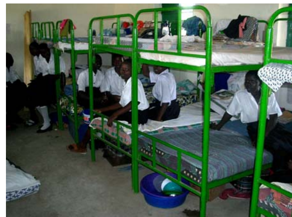
Auch in Itula ist das Mädchenwohnheim fertig geworden; fürs Gruppenbild dürfen die Mädchen auch mal vormittags in den Schlafrum