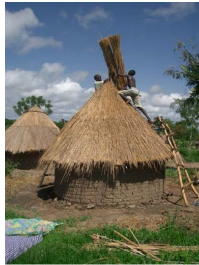
Jungs haben keine Wohnheime sondern müssen, wie hier in Alere ihre eigenen Tukuls bauen