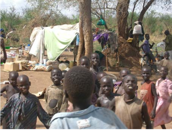
Das Aufnahmelager für die neu ankommenden Flüchtlinge aus dem Sudan, überwiegend Frauen und Kinder