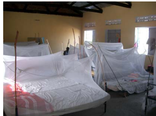
In Alere wird das neue Mädchenheim dem Schulleiter (li) übergeben