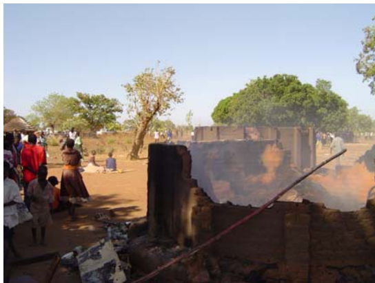
LRA Überfall in Dzaipi, eines der über 70 zerstörten Häuser